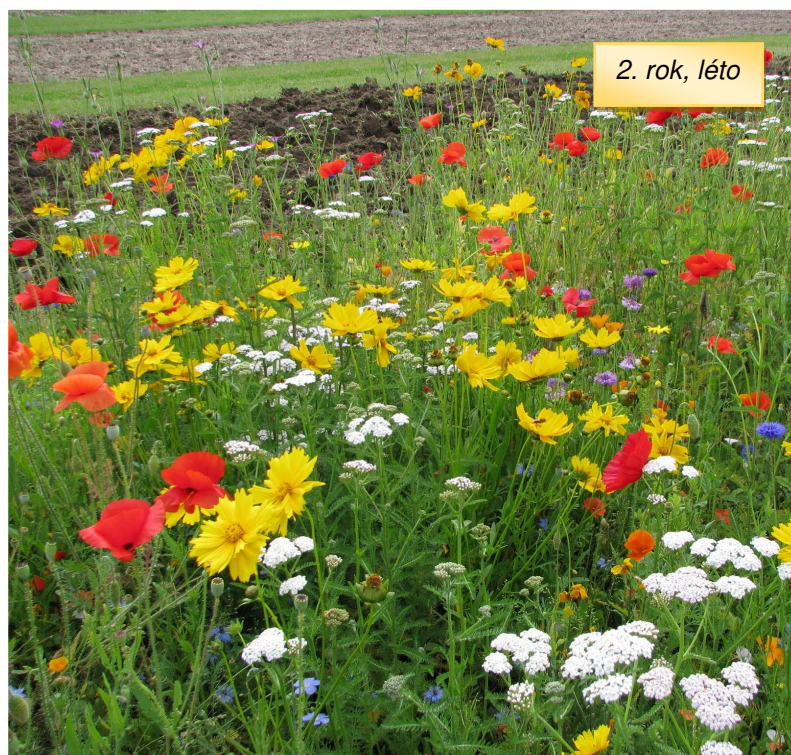
2. rok, léto